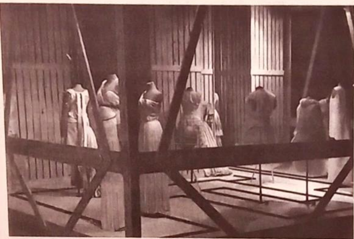
Hình 1. Một hoạt cảnh từ triển lãm Malign Muses tổ chức tại Bảo tàng Thời trang ở Antwerp vào năm 2005, do Judith Clark dàn dựng và giám tuyển.

giác của các nhà thiết kế đương thời trong buổi trình diễn bộ sưu tập của họ.